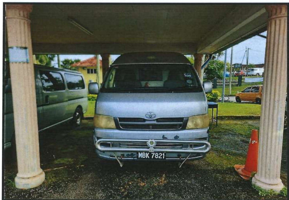
TOYOTA HIACE WINDOW VAN 2.5